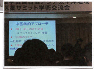
報告会の情報提供スライドの一部イメージ

5月3日(金)のGW期間中に行った妊活セミナー。今回は私が参加した研修や学会での有益な情報や感じてきたことの報告会。