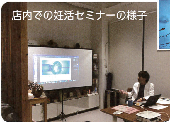
店内での妊活セミナーの様子